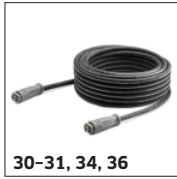
30-31, 34, 36