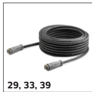
29, 33, 39