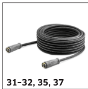
31-32, 35, 37